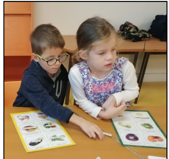
Lecture d'étiquettes autour des légumes pour les GS

3) Atelier dégustation à l'aveugle et reconnaissance des saveurs